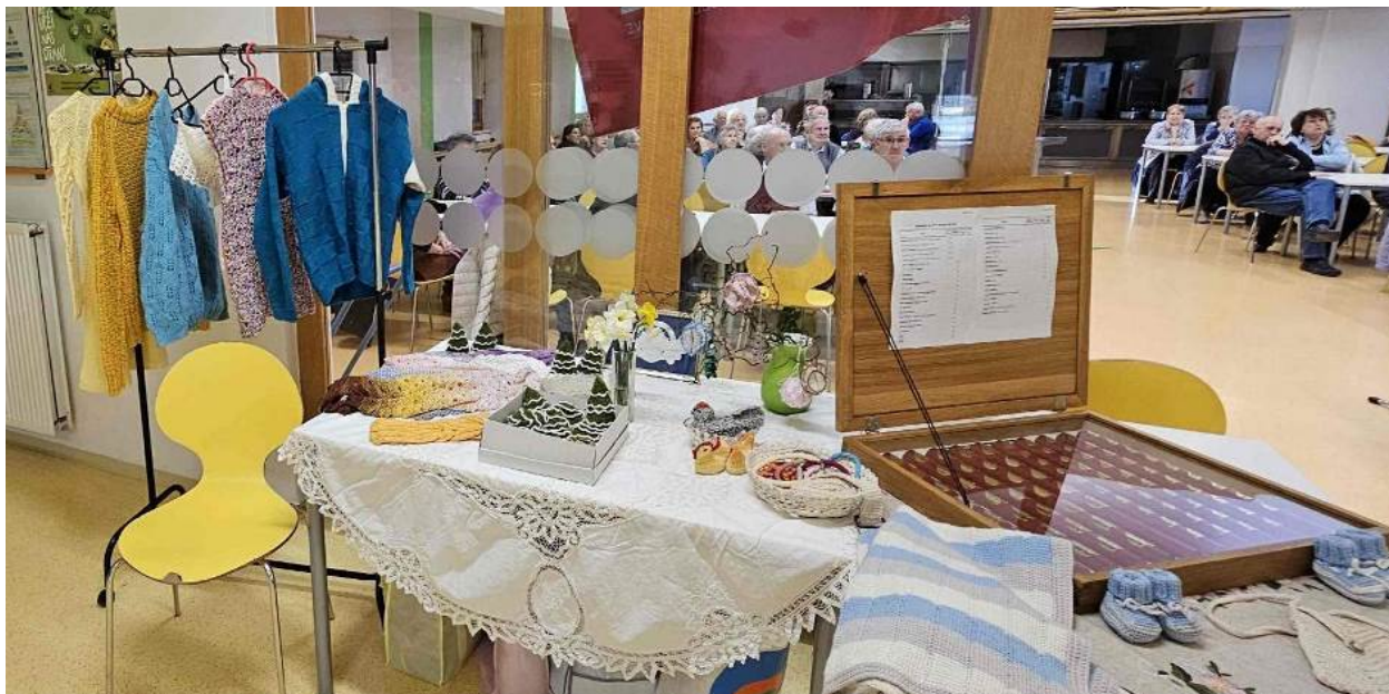
Razstava ročnih del (in vitrine z žeblički članstva ter zunanjih donatorjev za prapor) na zboru članov.