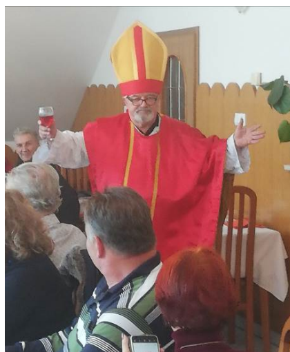
Del udeležbe in krst mošta na Martinovanju.