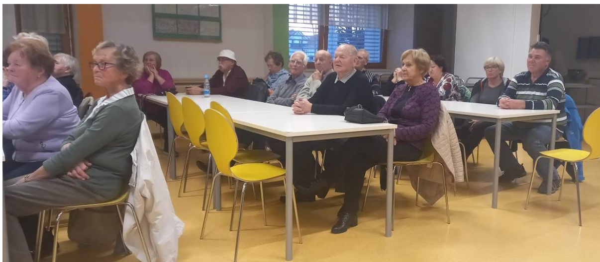
Številčnost udeležbe na sejah zbora članov je zaskrbljujoča.

Društvo je na redni seji zbora članov dne od 22. marca 2024 sprejelo in potrdilo letna poročila organov društva o poslovnem letu 2023 in sicer: upravnega odbora, častnega razsodišča in nadzornega odbora. Sprejelo je tudi vsebinski in finančni načrt društva za leto 2024. Seje zbora članov se je udeležilo 64 članov in članic, kar je bilo 44,44 % vseh, ki so do takrat vplačali članarino za leto 2024 ( preteklo leto: 61 = 19,37 % ). Prisotno članstvo je poleg obeh načrtov izvolilo še novega tajnika in sicer za dobo enega leta.