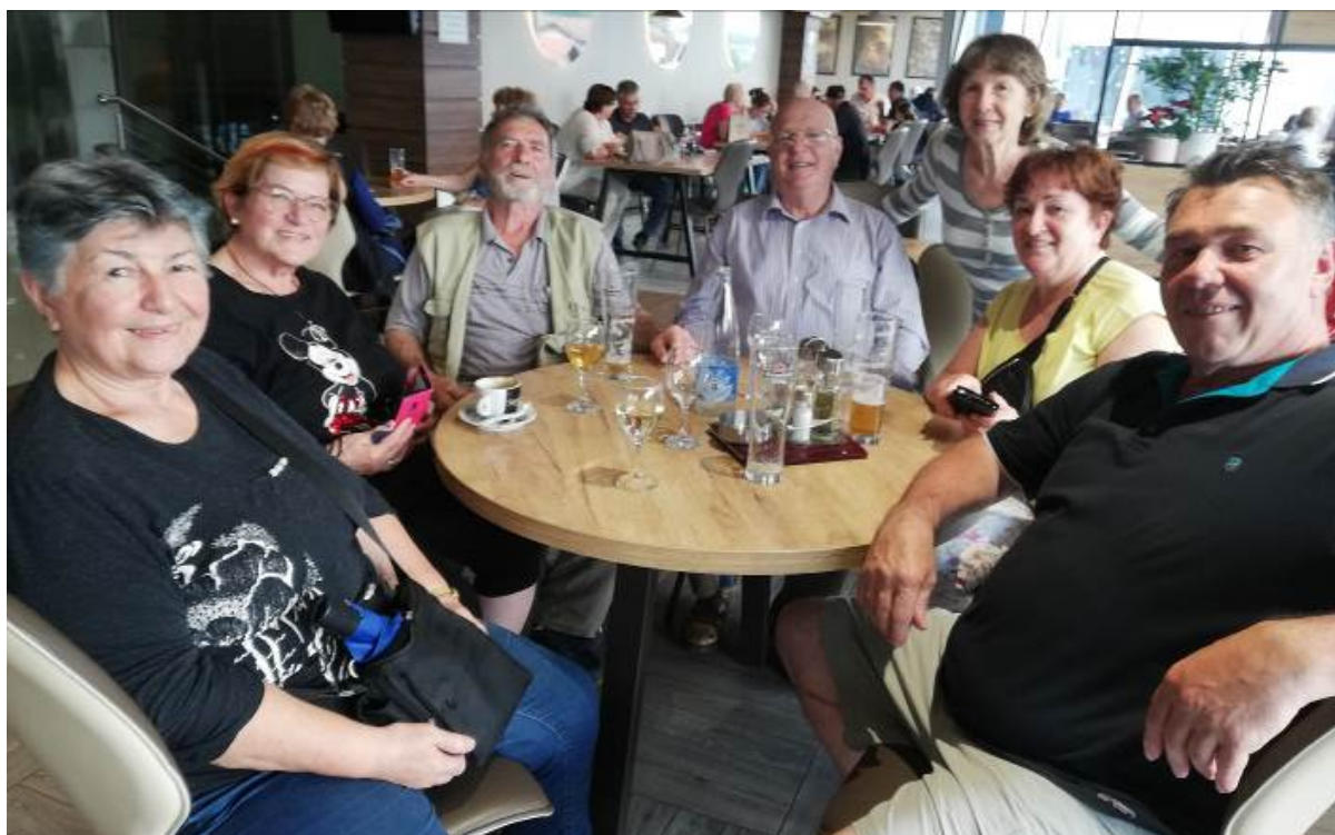
Del udeležencev zdraviliškega letovanja med počitkom v restavraciji veleblagovnice po 'napornih' nakupih.

V počastitev mater in žena (med 8. in 25. marcem) smo organizirali prireditev za članice društva in druge krajanke, ki jo imenujemo 'Marčna prireditev'; bila je 20. marca. Vabljene so samo članice, strežbo in nastop s kulturnim in pevskim vložkom pa opravimo samo člani.