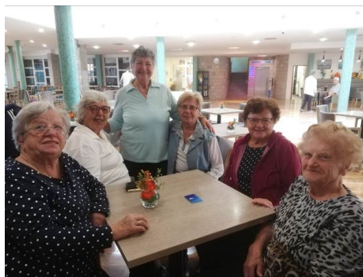
Razstavljeni tradicionalni čoln ob plaži hotela Delfin in skupina članic v avli hotela.