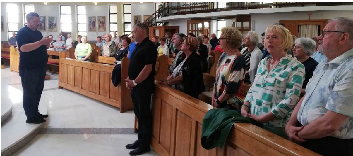
Izlet naše skupine v Baziliko sv. Marije Kondžilske (Komušina pri Tesliću), ki je za katolike v Bosni in Hercegovini to, kar je za Slovence Bazilika Marije Pomagaj na Brezjah.