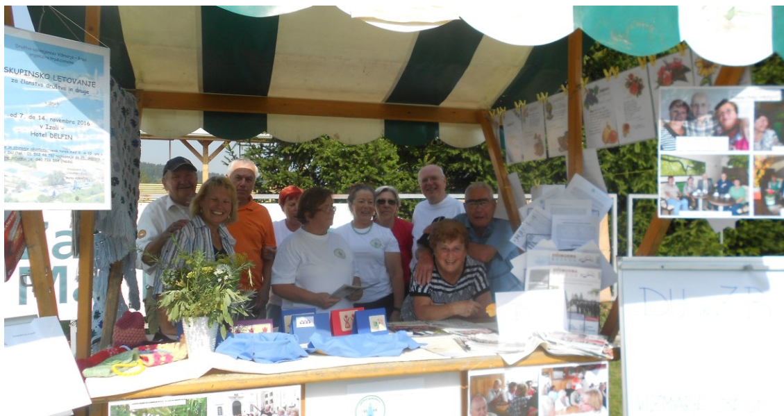
Na dnevu ČSŠ se skupaj predstavimo društva iz tretjega življenjskega obdobja.

V soboto, 5. oktobra, je bil Dan četrtnе skupnosti Šentvid (ČSŠ), na katerem se predstavi tudi naše društvo. Osrednja tema lanske predstavitve je bila razstava ročnih izdelkov.