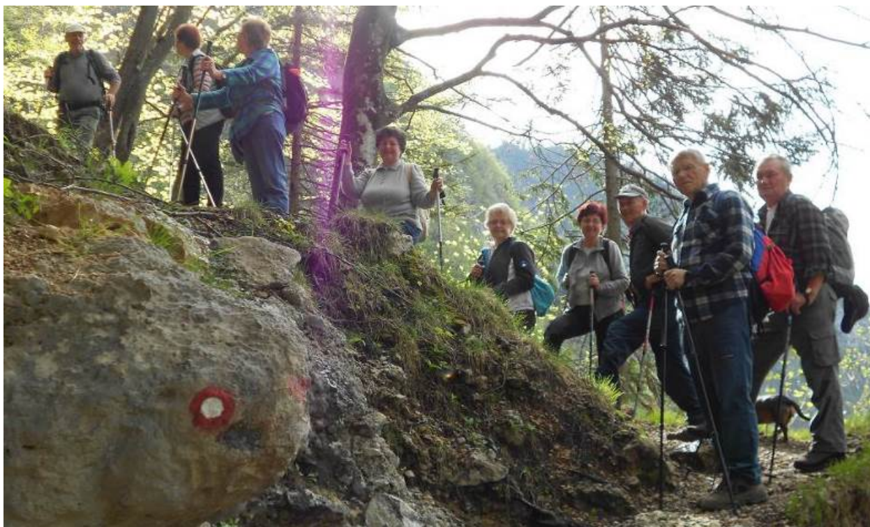
Pohod na Lepi kamen.