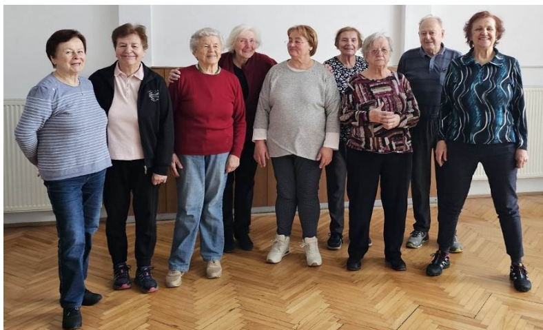
Del skupine na telovadbi v dvorani.