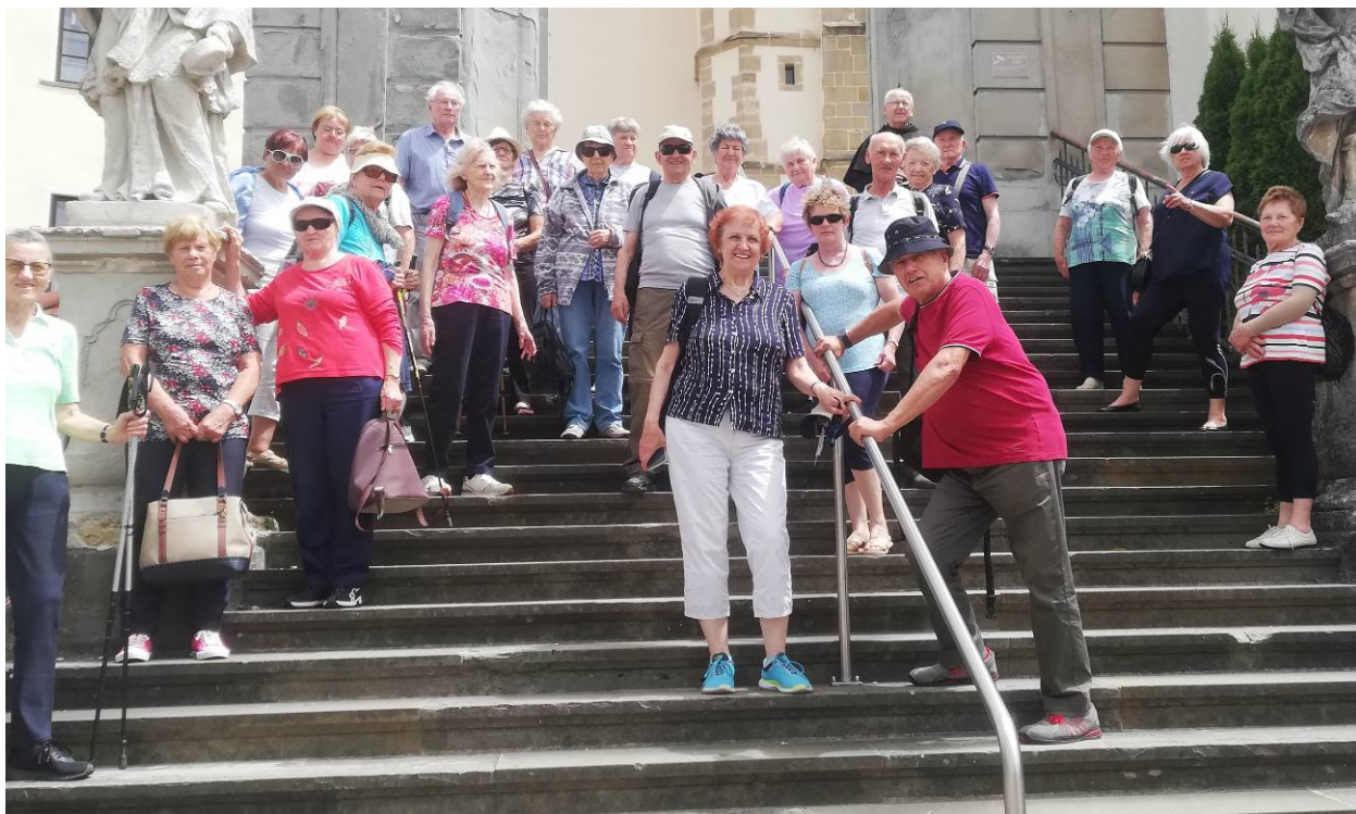
Udeleženci izleta na Ptujsko goro.